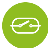
ACIONAMENTO POR RELÉ