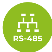
RS485 MODBUS RTU